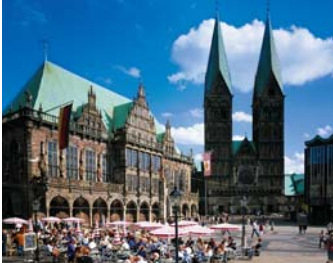
(Rathaus) 1405 1410