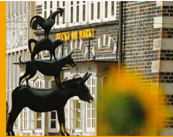
(Stadtmsi kanten) 1951